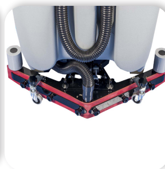
lo squeegee oscillante segue il movimento della macchina

the oscillating squeegee follows the machine movement